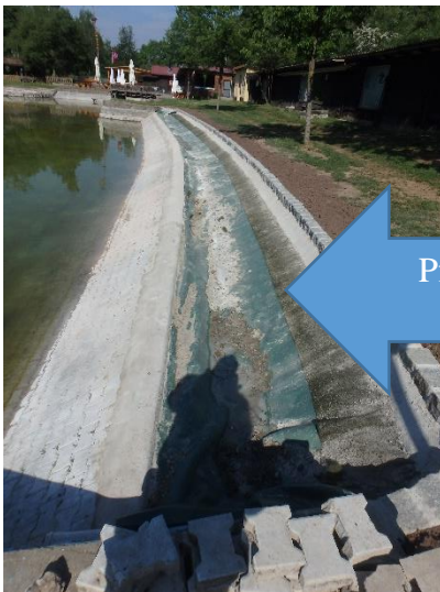
Pflanzstreifen mit Wassermulde

Die Wasserpflanzen haben die Aufgabe das Wasser zu reinigen und dem Wasser die Nährstoffe zu entziehen. Die Wasserqualität soll dadurch verbessert werden. Je nach Pflanzentyp wird im Wasser Sauerstoff produziert oder/und Nährstoffe entzogen.